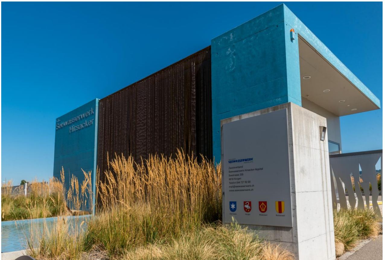
Betriebsgebäude, Seewasserwerk Hirsacker