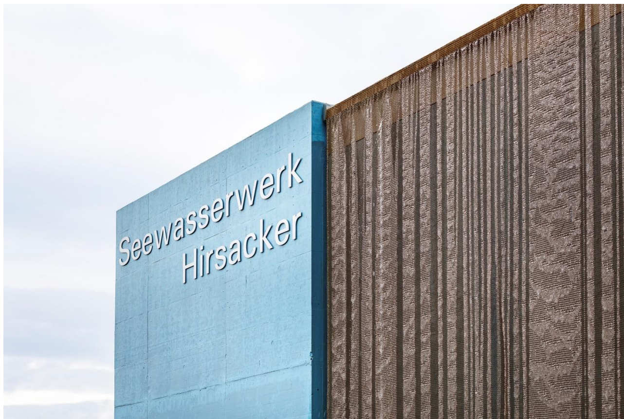
Seewasserwerk Hirsacker, Horgen