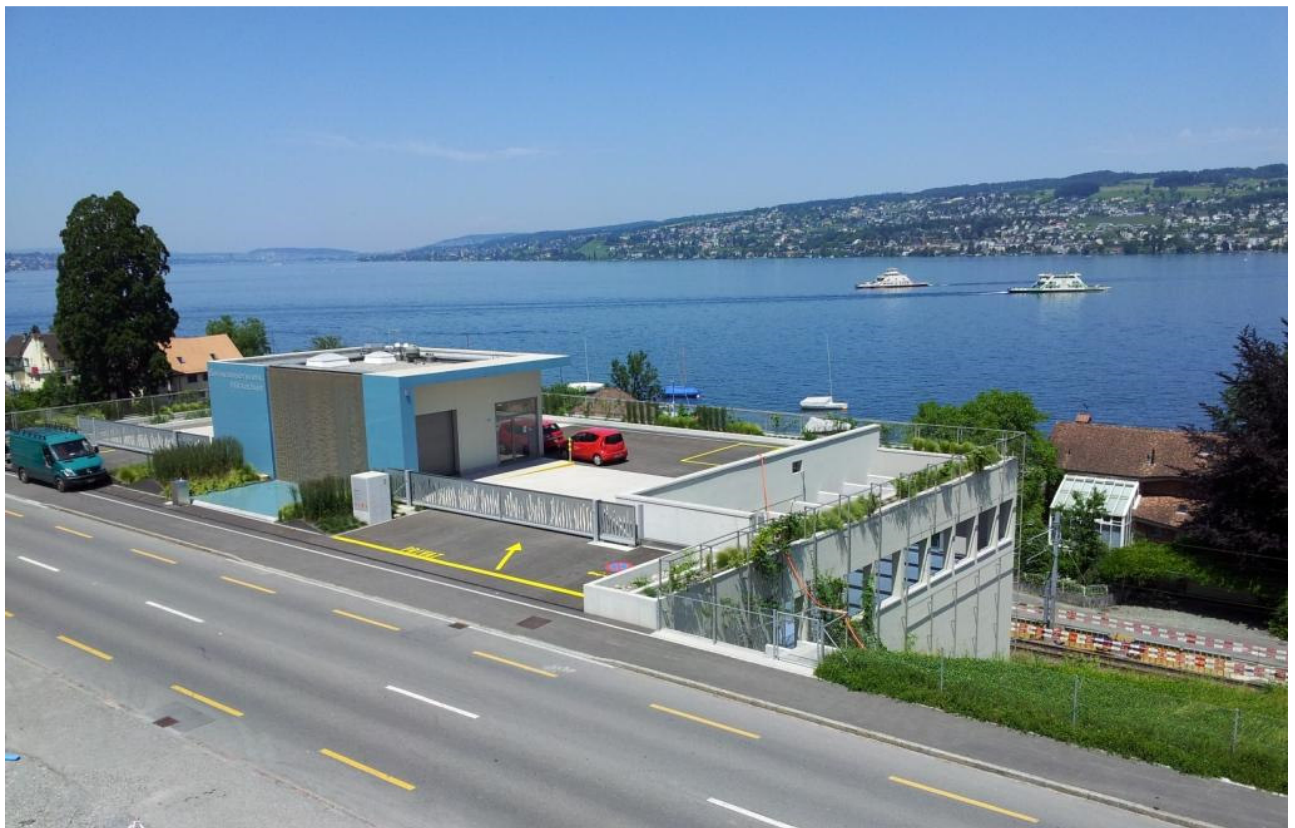
Seewasserwerk Hirsacker, Horgen